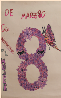
2º Premio - Felicidad (CEIP Mayor Zaragoza)