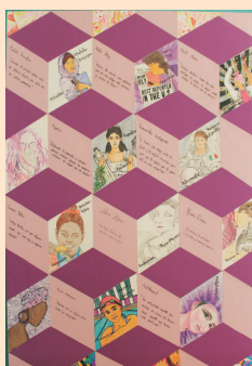
2º Premio - Grupo Hipatia (IES MEDITERRÁNEO)