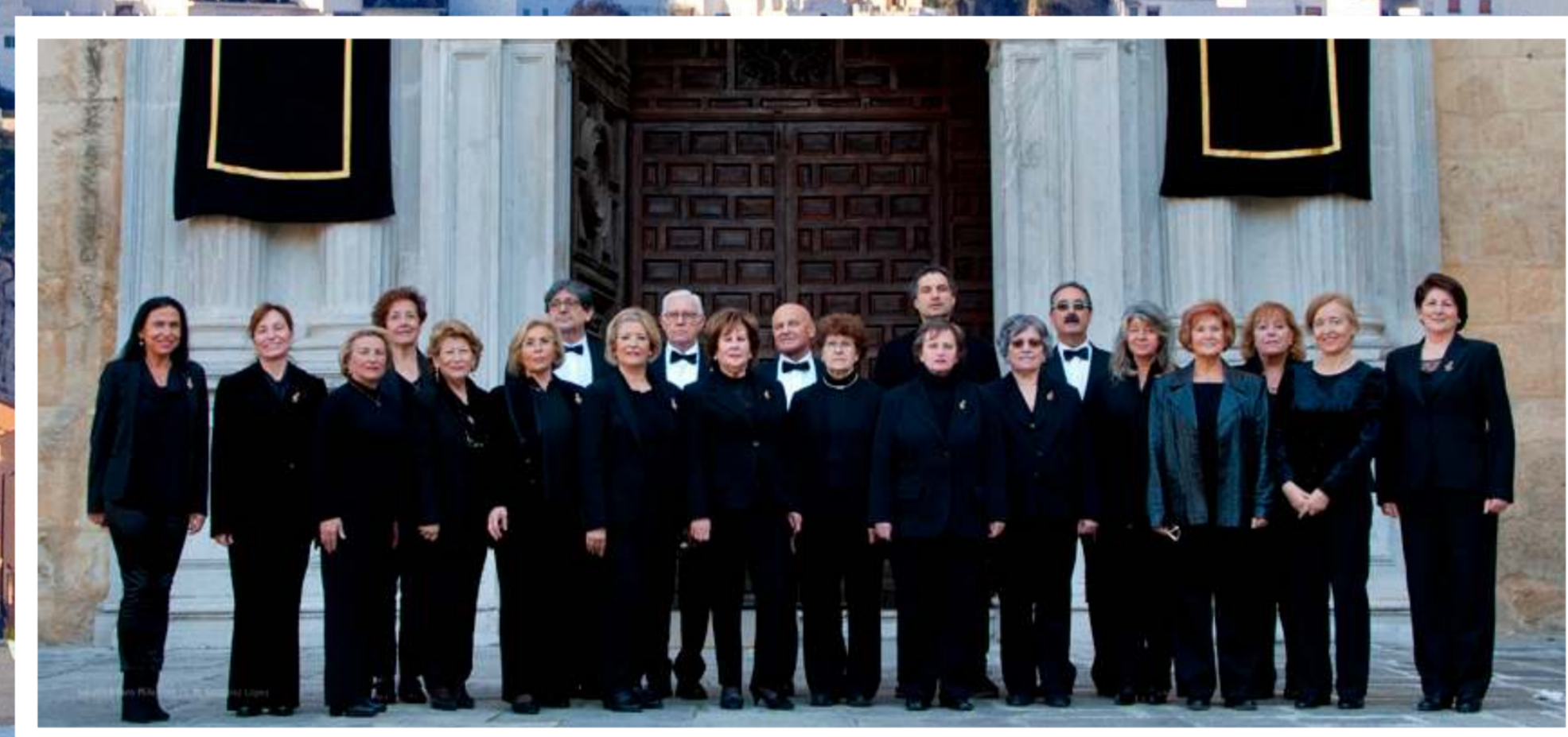
"CORO MILLENIUM" GRANADA