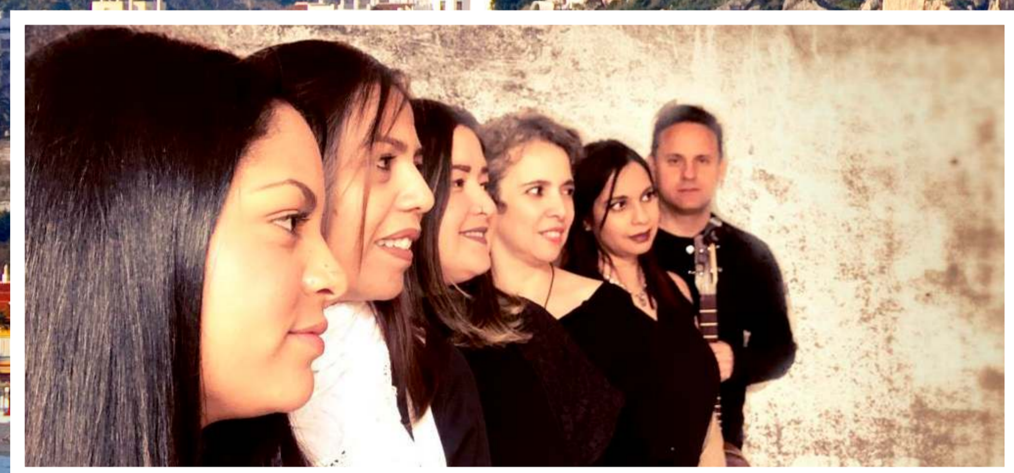
"GRUPO VOCAL PRACTICANTES" VENEZUELA