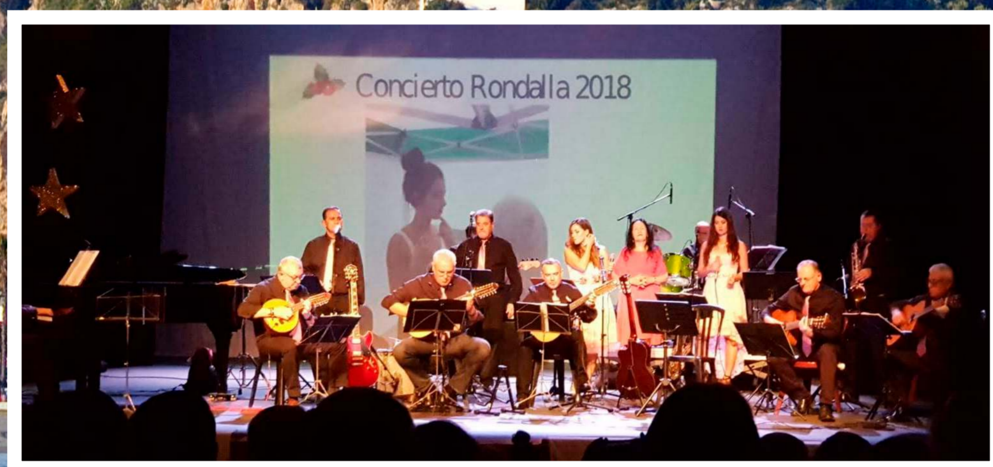
"RONDALLA SIERRA ALMJARA" NERJA