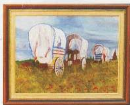
KOHLI MICHEL FLICKR KOHLI MICHEL