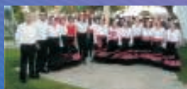
coro rociero brisa del rocío virgen del mar